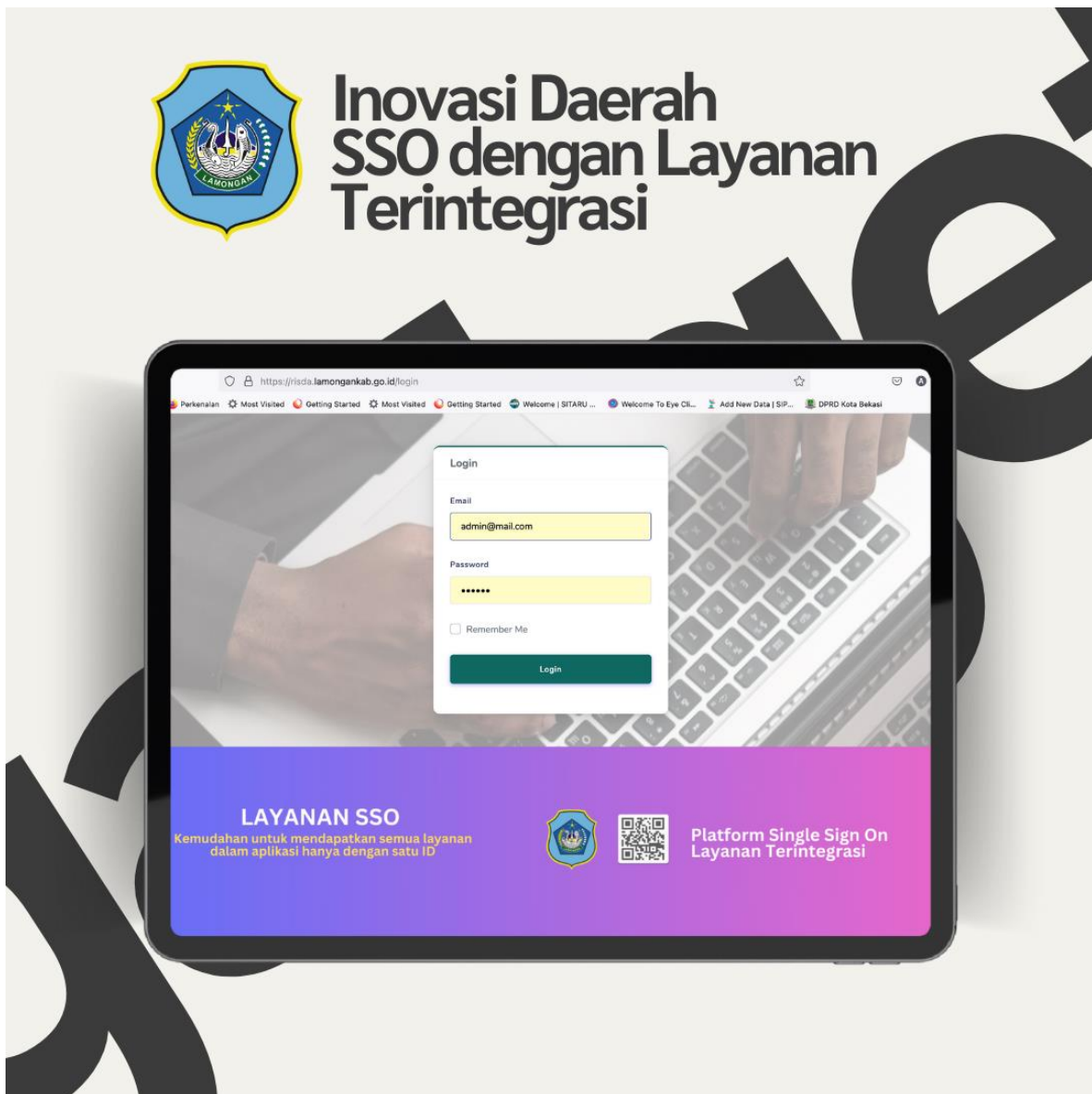
Gambar 2.1 Penggunaan SSO dalam Layanan Terintegrasi Inovasi Daerah Kabupaten Lamongan