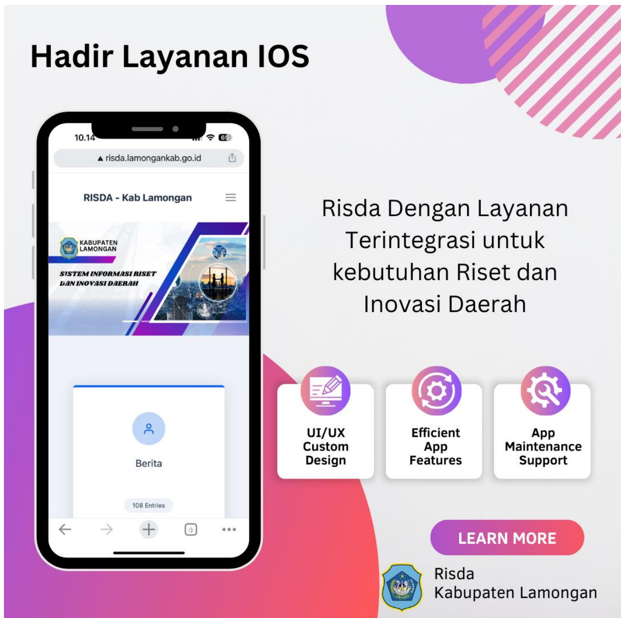
Gambar 2.2 Informasi Layanan di Inovasi Daerah di Kabupaten Lamongan

inovasi menerapkan kemudahan layanan informasi dengan didukung aplikasi IOS dan android . berikut layanan informasi dapat diakses dengan menginstal hal berikut :