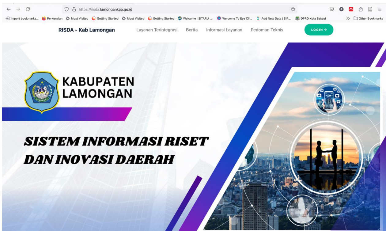
Gambar 2.3 Risda dalam menunjang inovasi daerah berbasis IT

Kabupaten Lamongan terus berupaya untuk mendorong pertumbuhan dan kesejahteraan masyarakat melalui berbagai inovasi daerah yang berkelanjutan. Dengan semangat kolaborasi antara pemerintah, masyarakat, dan sektor swasta, Kabupaten Lamongan telah meluncurkan sejumlah inisiatif yang bertujuan untuk meningkatkan kualitas layanan publik, mengoptimalkan potensi lokal, serta memperkuat daya saing daerah. Inovasi-inovasi ini mencakup berbagai sektor, mulai dari pertanian, perikanan, pendidikan, hingga teknologi informasi, yang semuanya dirancang untuk menjawab tantangan zaman dan menciptakan masa depan yang lebih baik bagi seluruh warga Lamongan. Melalui pendekatan yang kreatif dan berbasis pada kebutuhan lokal, Kabupaten Lamongan berkomitmen untuk menjadi pelopor dalam transformasi daerah yang berdaya saing tinggi dan berkelanjutan. Berikut kami menghadirkan penggunaan IT dalam Alat kerja inovasi daerah di kabupaten Lamongan: