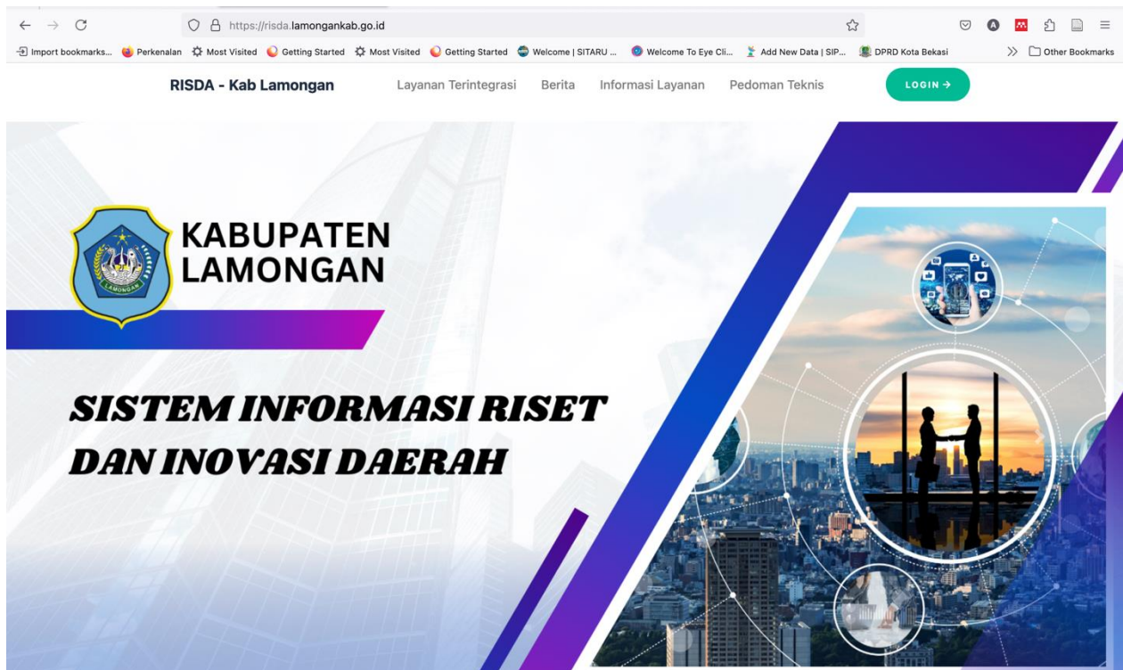
Gambar 2.3 Risda dalam menunjang inovasi daerah berbasis IT

Kabupaten Lamongan terus berupaya untuk mendorong pertumbuhan dan kesejahteraan masyarakat melalui berbagai inovasi daerah yang berkelanjutan. Dengan semangat kolaborasi antara pemerintah, masyarakat, dan sektor swasta, Kabupaten Lamongan telah meluncurkan sejumlah inisiatif yang bertujuan untuk meningkatkan kualitas layanan publik, mengoptimalkan potensi lokal, serta memperkuat daya saing daerah. Inovasi-inovasi ini mencakup berbagai sektor, mulai dari pertanian, perikanan, pendidikan, hingga teknologi informasi, yang semuanya dirancang untuk menjawab tantangan zaman dan menciptakan masa depan yang lebih baik bagi seluruh warga Lamongan. Melalui pendekatan yang kreatif dan berbasis pada kebutuhan lokal, Kabupaten Lamongan berkomitmen untuk menjadi pelopor dalam transformasi daerah yang berdaya saing tinggi dan berkelanjutan. Berikut kami menghadirkan penggunaan IT dalam Alat kerja inovasi daerah di kabupaten Lamongan: