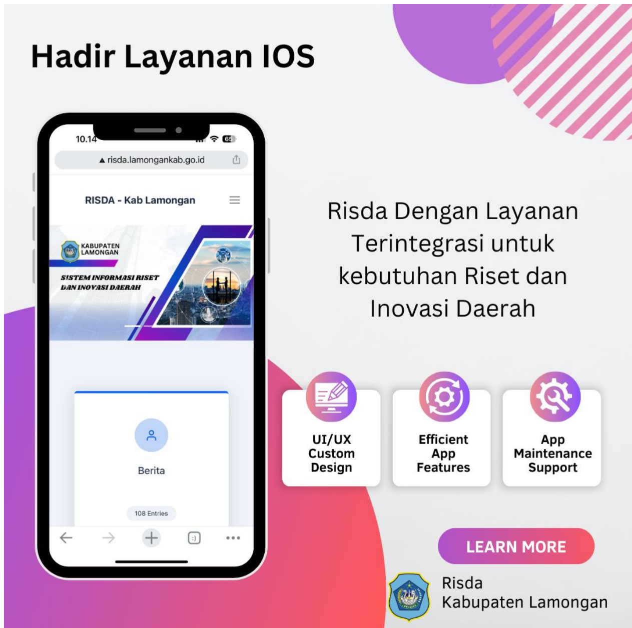
Gambar 2.2 Informasi Layanan di Inovasi Daerah di Kabupaten Lamongan

inovasi menerapkan kemudahan layanan informasi dengan didukung aplikasi IOS dan android . berikut layanan informasi dapat diakses dengan menginstal hal berikut :